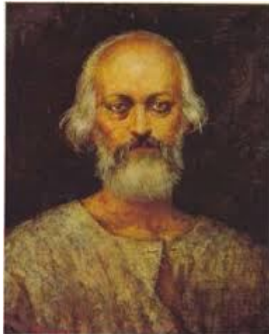
Боян Мага - Бениамин

16. Боян Мага. – Брат на цар Петър и в същото време висш богомилски свещеник – съвършен и маг. Архиепископ Боян се явява като един от най влиятелните и значими фигури за българската и европейската „еретическа” мисъл. Високо образован за онова време той е притежавал и дарбата основана на познанията по древни учения да превъплащава във видимост и поразличен начин енергийната си астралност. През 928 година в България пристигат двама сирийци за да се съберат с Боян, Богомил, патриарх Стефан, Симеон Антипа , Василий Византиец и Гаврил Лесновски в подземната зала на