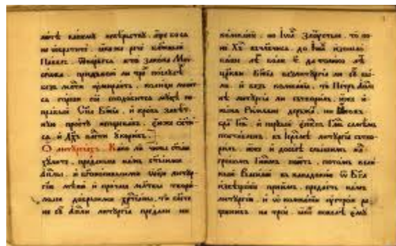
Тайната книга - препис