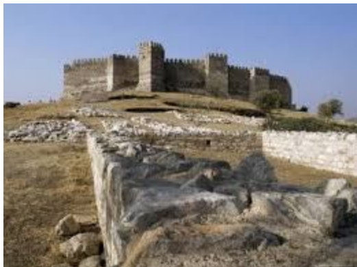
Крепостта Монсегюр – последната катарска твърдина