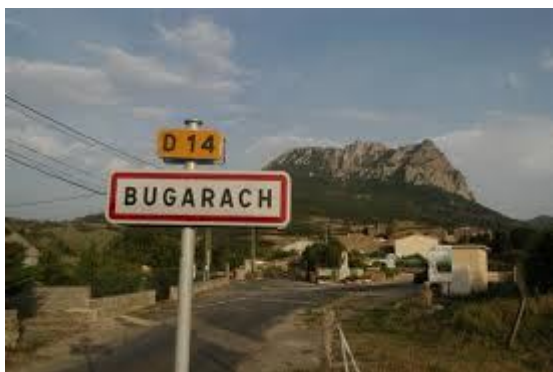
Селцето Бугараш в Южна Франция – мястото, където катарите са проповядвали своята религиозна философия